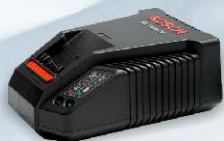
Rychlo nabíječka BOSCH