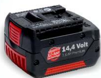
Náhradní baterie BOSCH Li-Ion