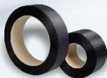
PP páska UNITAPE od výrobce UNIPACK