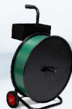
Univerzální odvíječ pásky H-84