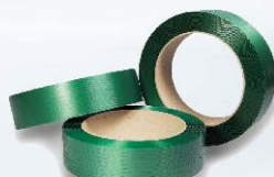
PET páska UNITAPE od výrobce UNIPACK