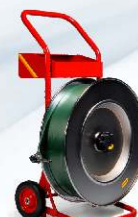
Profesionální odvíječ pásky H-84T