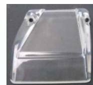
Kryt ovládacího panelu