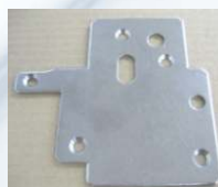
Ochranná odkládací ploška