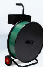
Univerzální odvíječ pásky H-84