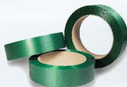
PET a PP páska UNITAPE od výrobce UNIPACK