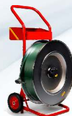
Profesionální odvíječ pásky H-84T