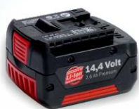
Náhradní baterie BOSCH Li-Ion