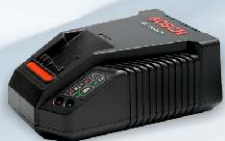
Rychlo nabíječka BOSCH